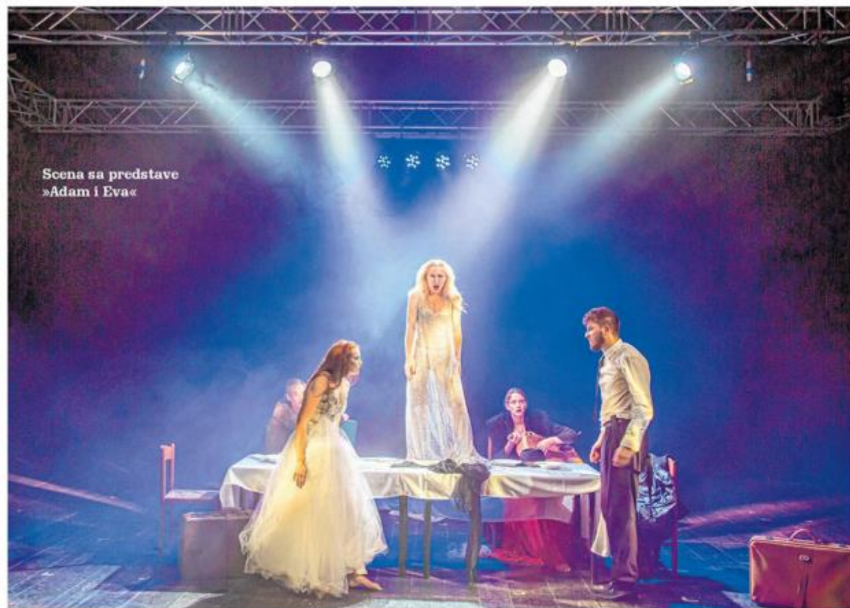
Scena sa predstave »Adam i Eva«