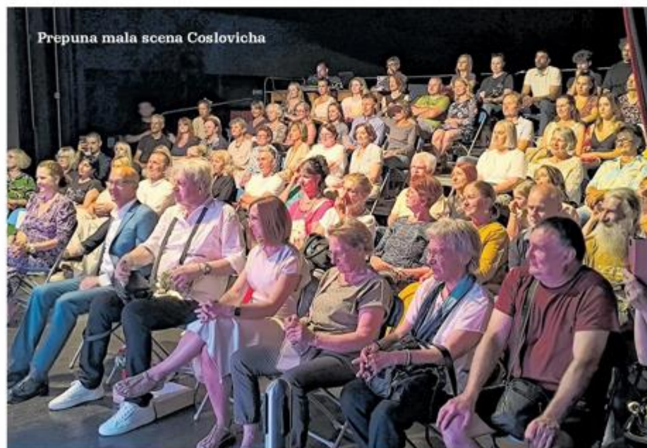
Prepuna mala scena Coslovicha

Svečano zatvaranje festivala i dodjela nagrada je u nedjelju 30. lipnja u 12 sati u auli kod kazališne dvorane »Antonio Coslovich«.