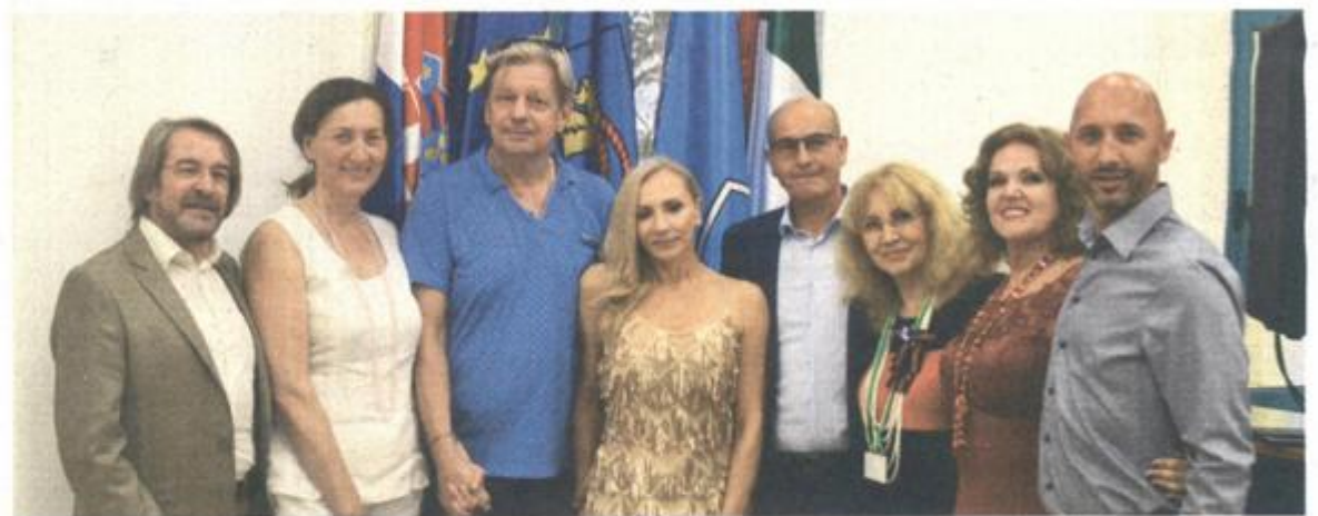
Sa svečanosti otvaranja 20. "Zlatnog lava"

talno, emocionalno i duhovno vrati u zagrljaj davno izgubljene obitelji, otac je zbunjen, usplahiren te bira oprečna sredstva, toleranciju i popustljivost prema sada već odrasloj ženi koja je tijekom svih godina izbjavanja iz doma izgubila vlastiti identitet. U tom sukobu dvoje ljudi koji su nakon duge potrage i nadanja za povratkom kćeri u već emotivno narušeni dom, došlo je do puknuća bračnih silnica, jer otac nije bio spreman suočiti sa silinom majčinske, nagonске borbe da skine čvrsti oklop u kojemu se podvojena Leana skriva. Kroz takozvani psihološki fenomen Stokholmskog sindroma u kojem žrtva da bi preživjela veže se na svog otmičara, otkrivamo razliku između pojma čuvstvene povezanosti i ovisnosti koju je poput uvjetovanog