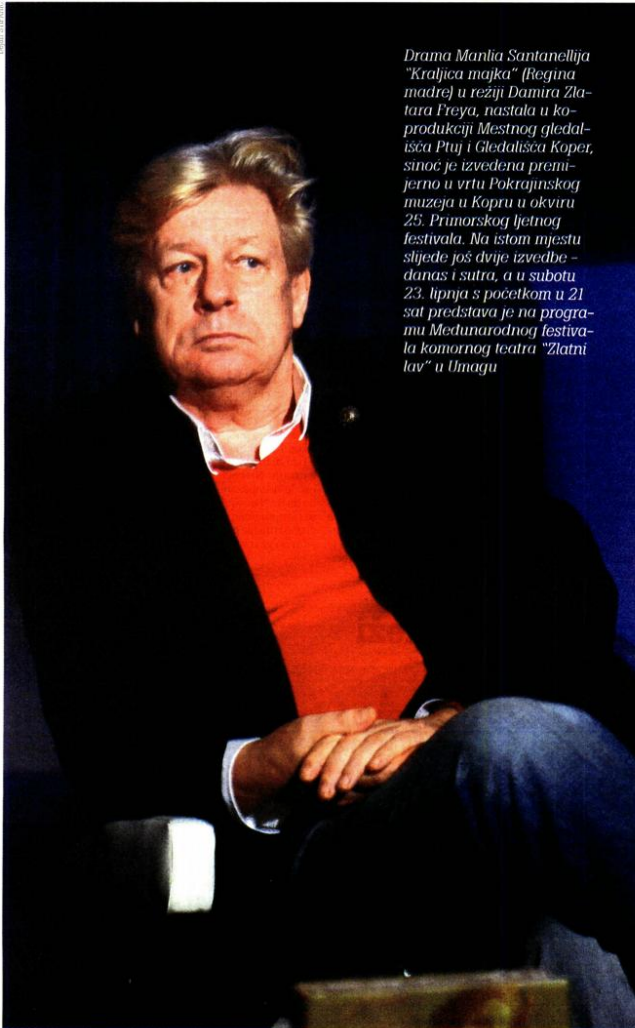
Damir Zlatar Frey

Drama Manlia Santanellija "Kraljica majka" (Regina madre) u režiji Damira Zlatara Freya, nastala u koprodukciji Mestnog gledališća Ptuj i Gledališća Koper, sinoć je izvedena premijerno u vrtu Pokrajinskog muzeja u Kopru u okviru 25. Primorskog ljetnog festivala. Na istom mjestu slijede još dvije izvedbe - danas i sutra, a u subotu 23. lipnja s početkom u 21 sat predstava je na programu Međunarodnog festivala komornog teatra "Zlatni lav" u Umagu