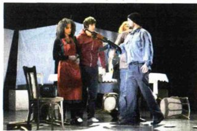
Iz nagradivane predstave "260 dana"

- Pišete u romanu da je u nošenju s traumama ključno bilo odvojiti srce od mozga, osjećaje od razuma.