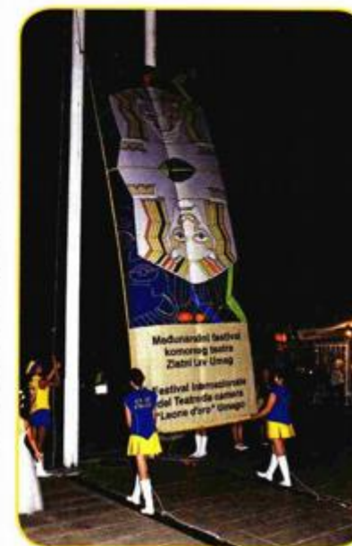
Stijeg festivala na vijorilo se na Trgu slobode

Od uvodne predstave Dimnjačar koja je izvedena po 1151 put, slijedile su predstave Coito ergo sum, Oštarica Mirandolina, Kraljevna na zrnu, Sluškinje, Ona, Harem, Thelma & Louise, (Tit)raj i Noćni portir.