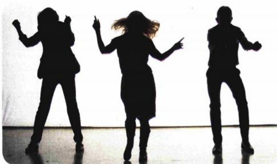
Ovogodišnji Grand prix je osvojila predstava "Do tu sega gozd" Drame Slovenskog narodnog gledališča iz Maribora