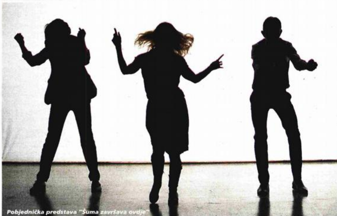
Pobjednička predstava "Šuma završava ovdje"